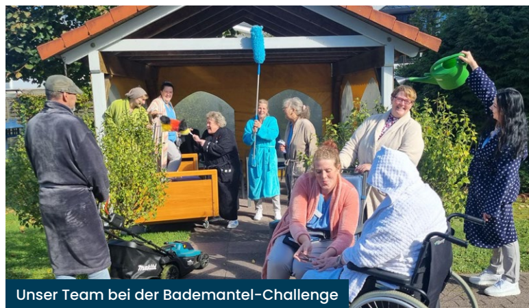
Unser Team bei der Bademantel-Challenge

Die Kreativität verbindet und lässt ungeahnte Talente erwachen. Eine besondere Erinnerung an die Weihnachtszeit: Ein Bewohner hatte am Malen miteinander teil genommen, sein Kunstwerk ins Zimmer gebracht und kam mit einem kleinen Geschenk zurück. Das war sehr rührend! „Wir freuen uns auf viele weitere künstlerische Projekte mit den Bewohnerinnen und Bewohnern und haben immer ein gutes Gefühl, wenn wir nach Hause gehen“, erzählen die Künstlerinnen.