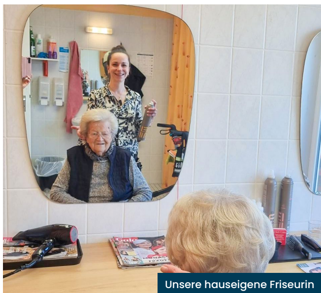
Unsere haus eigene Friseurin