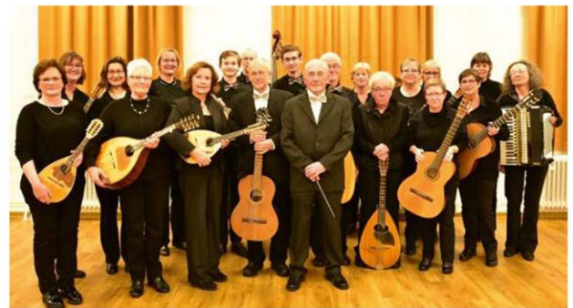
Lingener Mandolinorchester 1961 e.V.

Bei uns müssen Sie auf nichts verzichten – wir bieten Ihnen in unserem Haus einen umfangreichen Service an, damit Sie Ihr Leben ungestört genießen können. Im hauseigenen Kiosk erhalten Sie neben Zeitschriften, Süßigkeiten und Getränken auch Kosmetikartikel und kleinere Artikel des täglichen Bedarfs. Auch ein Friseursalon ist im Haus vorhanden. Für die vielen, auch öffentlichen Veranstaltungen und Fachvorträge wird der Vortragssaal genutzt, darüber hinaus steht Gästen und Bewohnerinnen und Bewohnern unser Kaminzimmer mit Bibliothek zur Verfügung. Über den freien Internetzugang können Sie weiterhin am sozialen Geschehen teilnehmen und Ihr gewohntes Umfeld aufrechterhalten.